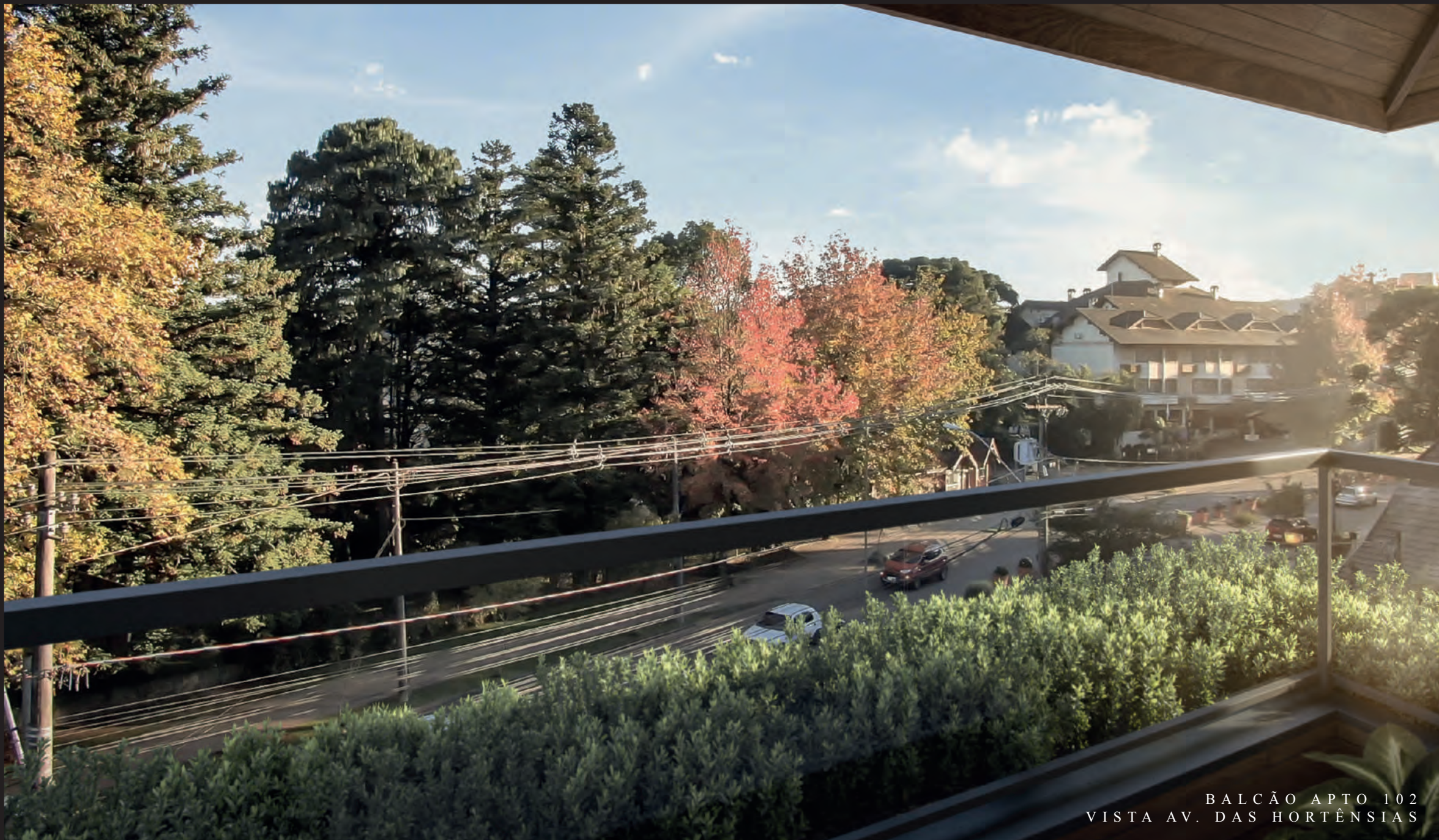
BALCÃO APTO 102 VISTA AV. DAS HORTÊNSIAS