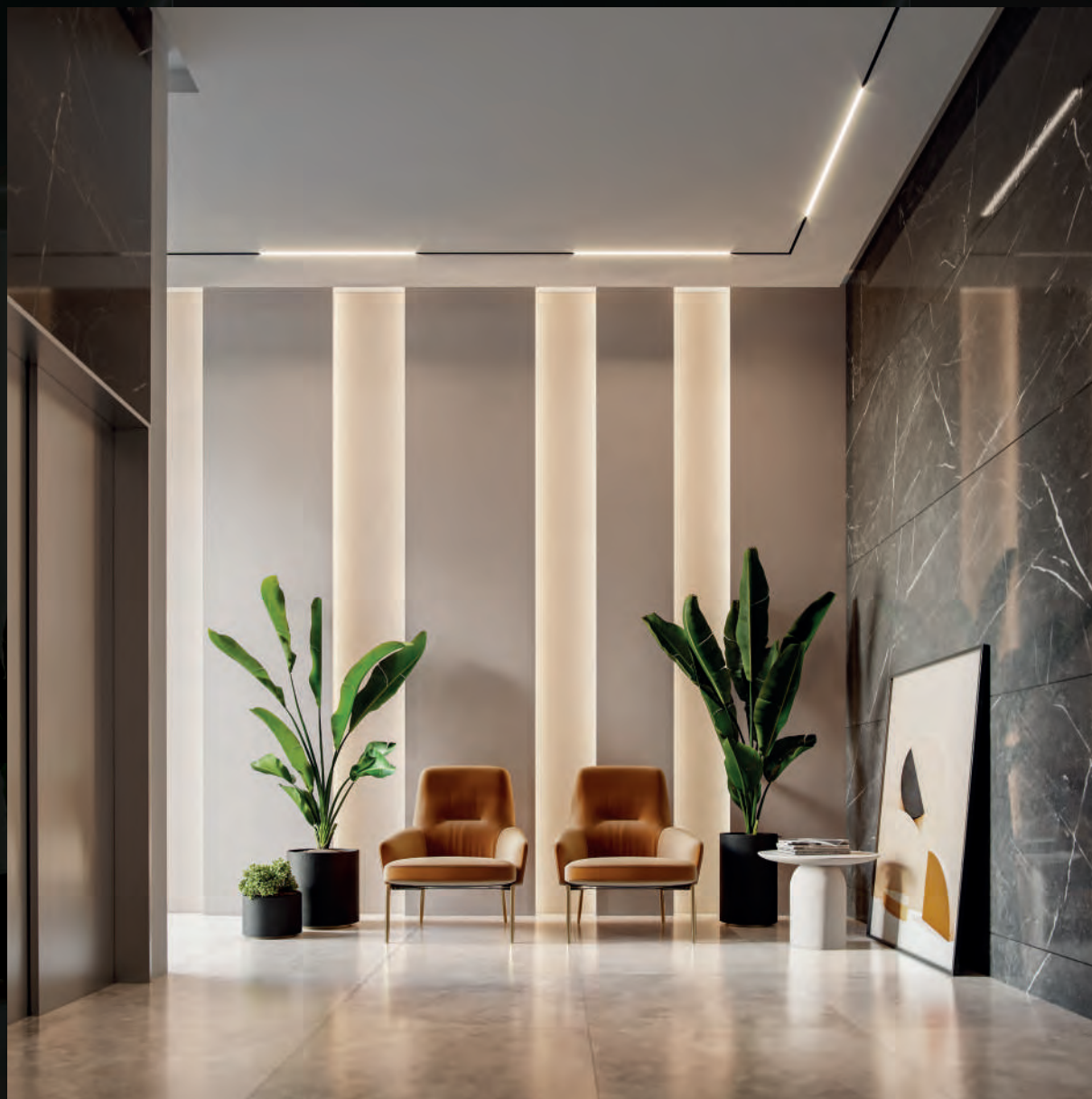
HALL DE ENTRADA RESIDENCIAL